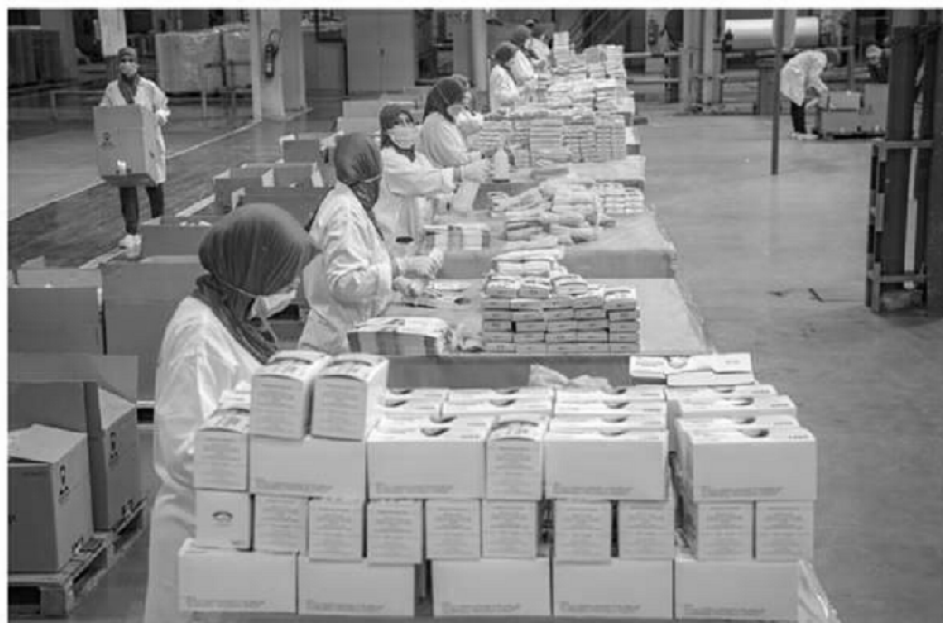
Un groupe de 8 industriels, se sentant menés par le bout de leur nez, ont alors présenté une démission collective du bureau de l'Amith-Nord le 14 mai dernier dans laquelle ils dénonçaient la manière peu orthodoxe avec laquelle l'initiative avait été gérée