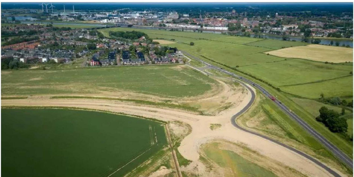
De contouren van de nog aan te leggen turborotonde